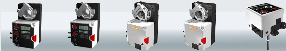
Volumenstromregler – Antrieb, Regelung und Sensorik in kompakter Bauform

VAV-Volumenstromregler von Gruner erfüllen die hohen Ansprüche der Klimatechnik. Insbesondere die Modelle 227V/VM setzen Maßstäbe, indem sie Planern und Architekten neue Anwendungen erschließen. Wichtige Argumente liefern das innovative Messkonzept, die voll-digitale Regelung und der integrierte Hochleistungs-Aktor mit 10 Nm Leistung. Gruner bietet zudem einen erweiterten Messbereich sowie kürzere Aufwärm- und Reaktionszeiten.